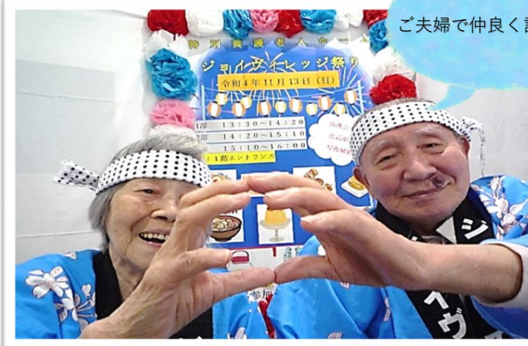
ご夫婦で仲良く記念撮影♪

11月1日、ジョイヴィレッジは開設丸8年を迎え9年目に突入しました。今年も無事に恒例の“ジョイヴィレッジ祭り”を開催することができました。感染対策上、今年も入居者様と職員のための小規模開催となりましたが、ご入居者様に喜んでいただけるよう、行事委員が中心となり、何か月も準備をかさねてまいりました。今年のお祭りメニューは、ラーメン・焼きそば・豚汁・だし巻き卵・チョコバナナ・プリン・梅ゼリーなど。お酒が好きな方には、ビールや梅酒もあります♪ お食事のあとは、くじ引きと一人ずつ記念撮影をしました。皆様に大変喜んで頂き、良い9年目のスタートをきることが出来ました！！