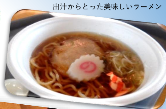
出汁からとった美味しいラーメン