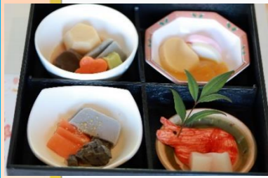
～ソフト食のお節～ (舌でつぶせるやわらかさです)