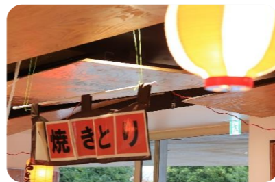
職員も一緒に楽しみました！