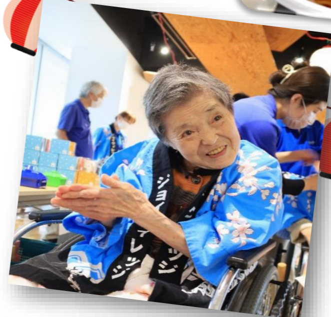
行事委員が大活躍です！