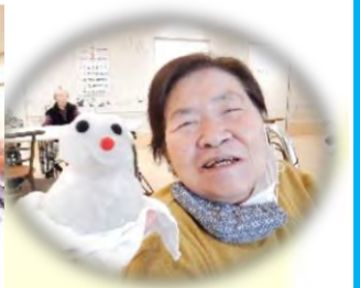
小田原では珍しく雪が積りました。雪だるまに皆様笑顔