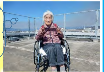
ちが冬良青の屋いくて上気は持空