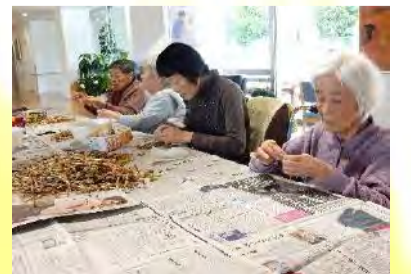
毎年恒例春の風物詩！ジョイヴィレッジ周りの土筆を摘んでみんなではかまを取り、甘辛く煮ていただきました♡