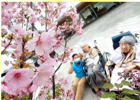
今年もジョイヴィレッジの桜がきれいに咲きました