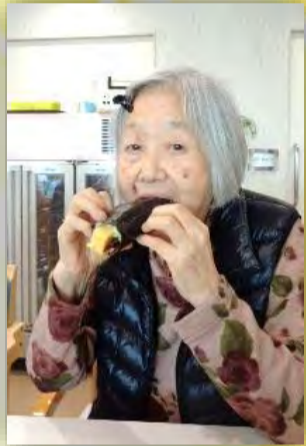
鬼は外！福は内！！鬼をやっつけて恵方巻を食べれば今年も無病息災間違いなし