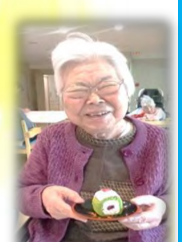
ひな祭りもおいしいものをいただきました♡