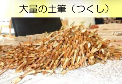
大量の土筆（つくし）